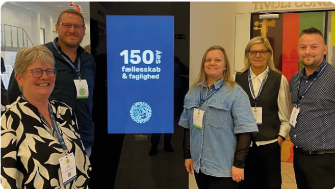
Kredsstyrelsen til Kongres 2024 i Danmarks Lærerforening.