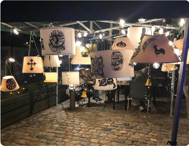
Til Næstved Kulturnat var Næstved Lærerkreds sammen med Folkekirkens Skoletjeneste og Næstved Provsti med til at kaste lys over fællesskabet.